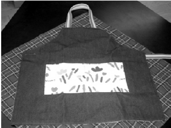
フロントポケット